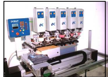
Alien en línea