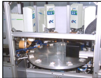
Alien en mesa giratoria