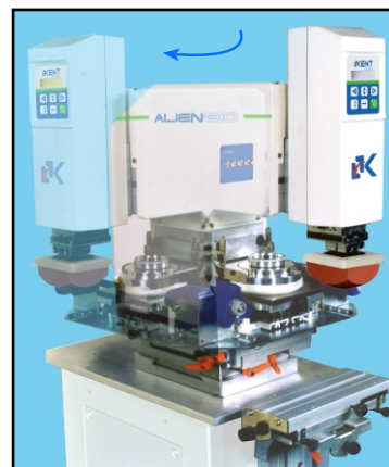
Giro de 90° para el cambio fácil de tampón/placa.