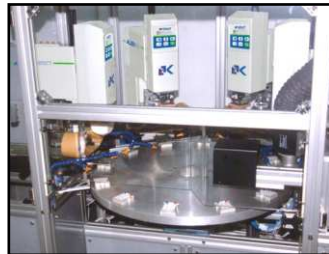
Alien en mesa giratoria