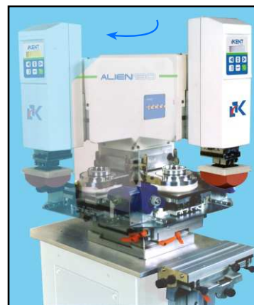
Giro de 90° para el cambio fácil de tampón/placa.