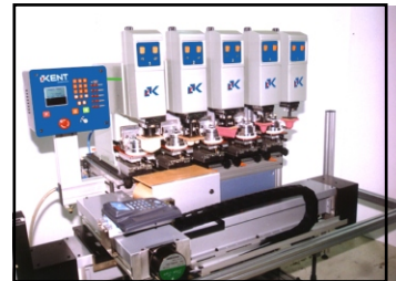
Alien en línea